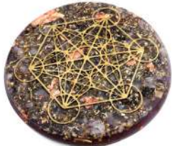
CUBO DI METATRON 18 cm