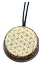
FIORE DELLA VITA