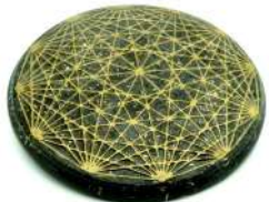
TESSERATTO 18 cm