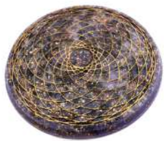
ACCHIAPPASOGNI 18 cm

La parola MANDALA in sanscrito significa cerchio e, nella nostra serie, si tratta di una serie di piatti (le misure vanno da 16 a 19 cm) rappresentanti simboli sacri. I piatti mandala in orgonite sono concepiti allo scopo di offrire una protezione costante e sulla parte esterna è rappresentato un diagramma con elevata frequenza di vibrazione. Alla base è stata aggiunta, tramite apposita colatura o innesto, una spirale in rame, visibile o meno a seconda della tipologia di lavorazione del mandala. Possono essere usati per tenerli sul tavolo oppure per appenderli al muro in modo da far pervadere l'ambiente di energia orgonica e fare anche da elegante arredamento. La miscela, oltre alle normali componenti orgoniche, contiene polvere di ferro, polvere di shungite nera, quarzo rosa e bianco in scaglie. Tutti i nostri modelli di mandala sono ritoccati a mano sul disegno in rilievo. La confezione contiene una User Guide in italiano.