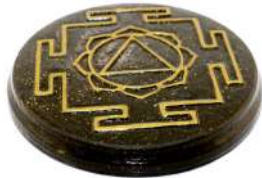
TARA SHAKTI 17 cm