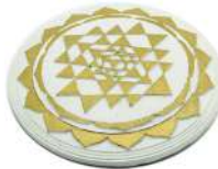
TRIPURA BIANCO 16 cm