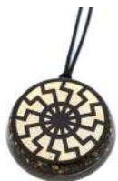
CERCHIO DELLE 12 STAGIONI MEROVINGE