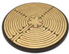
LABIRINTO DI CHARTRES 18 cm