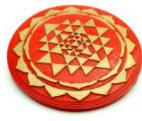
TRIPURA ROSSO 16 cm