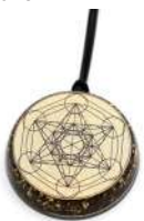
CUBO DI METATRON