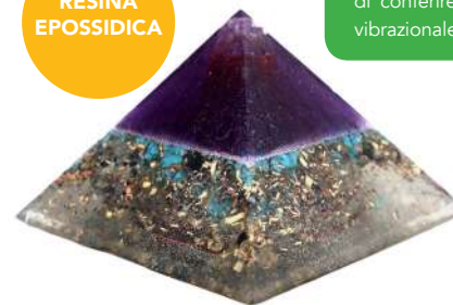
BLUE SKY NATURE

TUTTE LE PIRAMIDI SONO DISPONIBILI NELLE MISURE 9 / 15 / 20 cm DI BASE