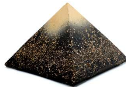
ENERGIA DI GIZA

Durante la fase di catalizzazione l'orgonite viene esposta a delle specifiche frequenze audio in modo da conferirle specifiche informazioni vibrazionali (vedi gli studi di Masuaro Emoto). La miscela delle piramidi, oltre ai componenti base organici (resina e metallo), contiene anche polvere di shungite nera (tipo-2), quarzo rosa e bianco; la 9 cm ha una sola punta di quarzo ialino (rock quartz), mentre le 15 e le 20 cm hanno 5 punte-cristalli di quarzo ialino disposte quattro alla base (uno per ogni lato) e una verso il vertice superiore. Inoltre c'è anche una spirale in rame posta alla base. La base è ricoperta di materiale (feltrini o simil-velluto) anti-scivolo. Posizionare nella stanza con le superfici laterali disposte verso i quattro punti cardinali. NOTA BENE: si tratta di un prodotto artigianale per cui ognuno di questi può essere leggermente differente da un altro per colore o lavorazione. La confezione contiene una User Guide in italiano