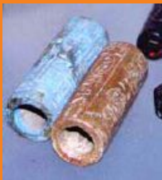
Pepi II con in mano i Cilindri e gli originali qui a destra al Metropolitan Museum di New York